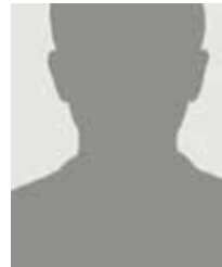
Fler i personalen Husmor, administration samt inhyrda externa utbildare.